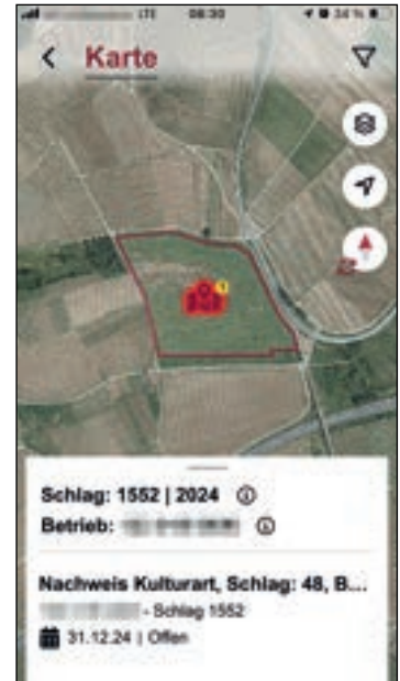
Auswahl eines Schlages in der Karte

Satellitenbilddauswertung Hinweise auf nicht förderfähige Anteile (z. B. Wald, Wege, Holzlagerflächen, Ballenlager, Mieten, Silos, etc.) oder auf eine Änderung der Hauptbodennutzung (z. B. Umwandlung von Dauergrünland in Ackerland)?