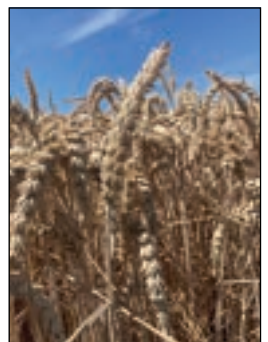
Es werden zwei Fotos benötigt. Einmal ein Bild des Schlags im Querformat und ein Detailbild der Kultur.