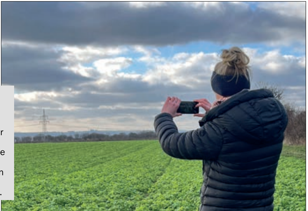
Die LEA-Foto-App ermöglicht es den Landwirten, auf aktuell freiwilliger Basis den Nachweis erfüllter Fördervoraussetzungen zu erbringen.

Um Widerspruchsverfahren und unnötige Nachfragen zu vermeiden, wird den landwirtschaftlichen Betrieben in Rheinland-Pfalz seit November 2024 die sogenannte „LEA-Foto-App“ angeboten. Die Funktionen und Vorteile, die diese digitale Unterstützung in der Agrarförderung bietet, werden nachfolgend erläutert.