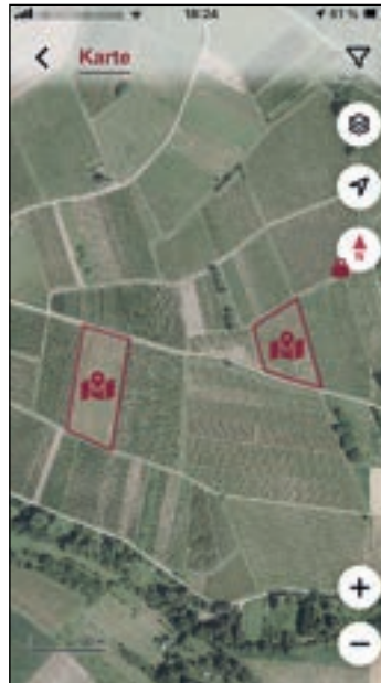
Übersicht der beantragten Schläge in der Karte